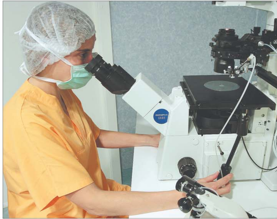
Antes de la extracción, se estudia el estado de salud físico y mental de la donante.

Además, antes de la donación, la mujer se somete a un estudio en el que se analiza su estado de salud físico y mental. «Gracias a esto, en algunos casos hemos ayudado a detectar enfermedades que algunas mujeres desconocían que tenían. Así, por el simple hecho de ser solidarias, se llevan una información muy útil para su vida personal», agrega Saumell.